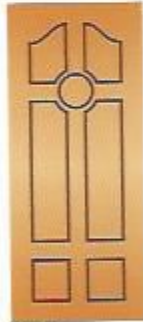
38. Мишень II