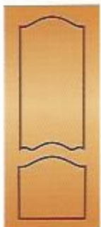
95. Экзотика III