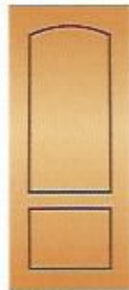
80. Экспромт I