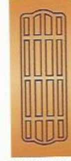
47. Прима II