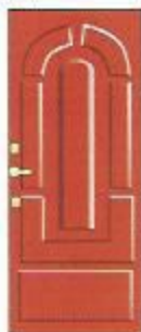
Санта Барбара ОЛ