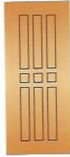
34. Метро II