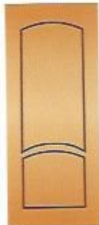
26. Классик II