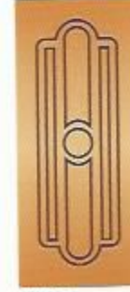
46. Прима I