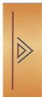
56. Россиянка III