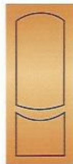
81. Экспромт II