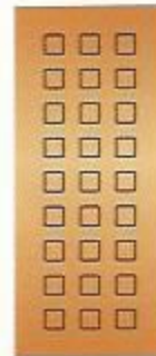
72. Триумф II