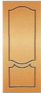
83. Экстра I