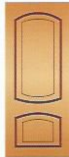
4. Аврора IV