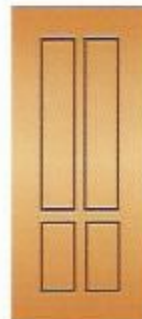
23. Кватра II