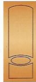
18. Диор II