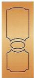
88. Эксклюзив II