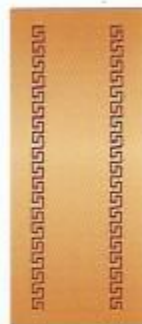
58. Степ II