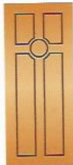
37. Мишень I