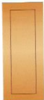
25. Классик I