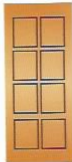
43. Октава III