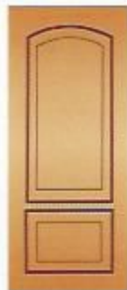
1. Аврора I