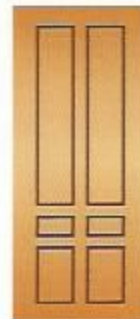
24. Кватра III