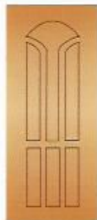
13. Гранд I