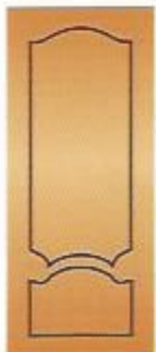
94. Экзотика II