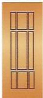
63. Союз I