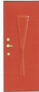
Франг 2 ОЛ