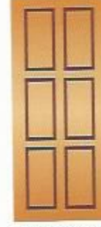
41. Октава I