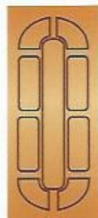
61. Султан II