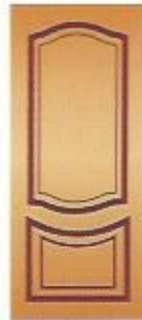
3. Аврора III