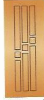
35. Метро III