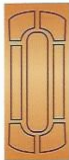
60. Султан I