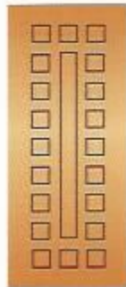
71. Триумф I