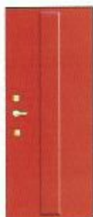
Классик 2 ОЛ