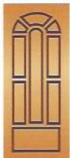
62. Султан III