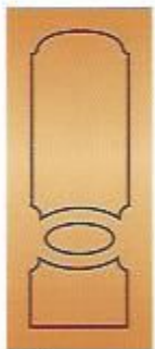
87. Эксклюзив I