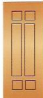
64. Союз II