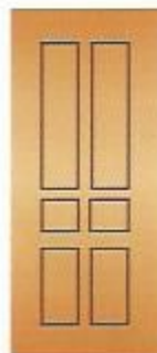
22. Кватра I