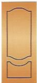
93. Экзотика I