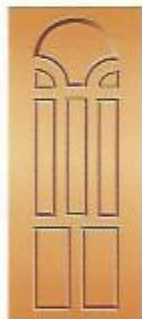
15. Гранд III