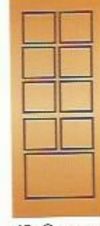
42. Октава II