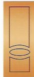
17. Диор I