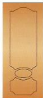
19. Диор III