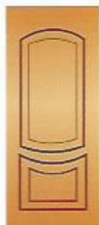
90. Этюд II