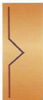
55. Россиянка II