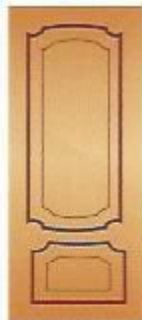
2. Аврора II