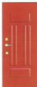
Аля Эммеда ОЛ