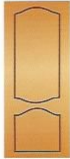
85. Экстра II