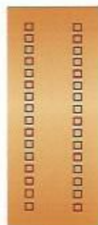
57. Степ I