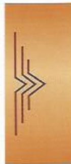
54. Россиянка I