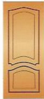
89. Этюд I