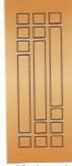
29. Лего I