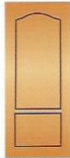
82. Экспромт III