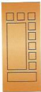
31. Лего III