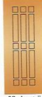
30. Лего II