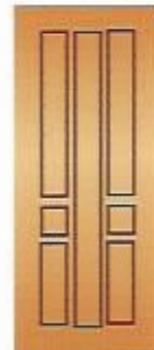
65. Союз III