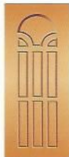
14. Гранд II